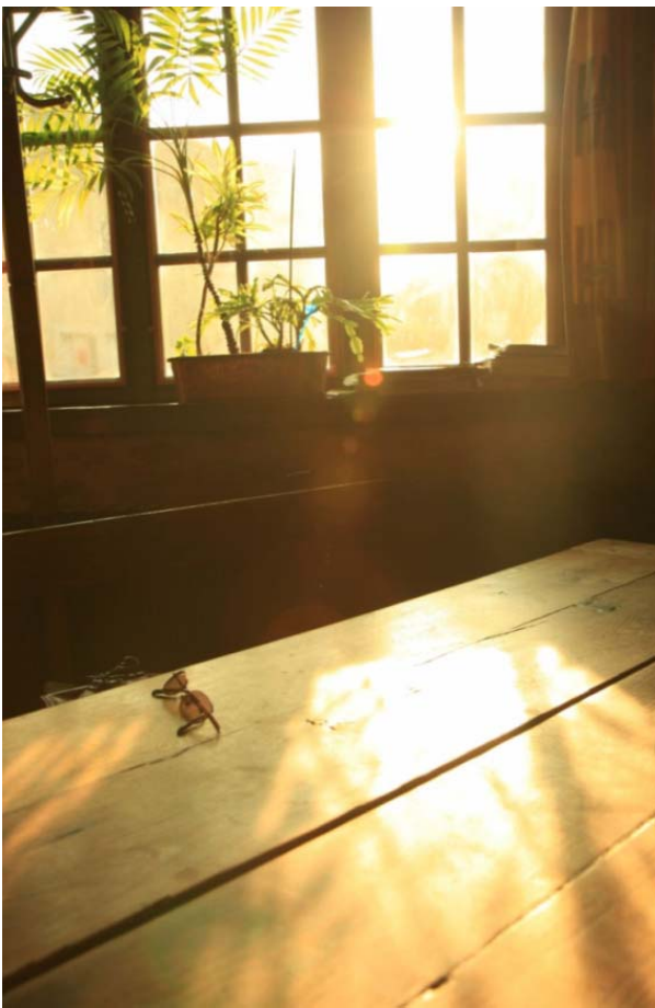
夕食に寄った村のレストラン。 陽も長くなり9時頃まで暗くならない。 子供も夜更かしになる。。。。