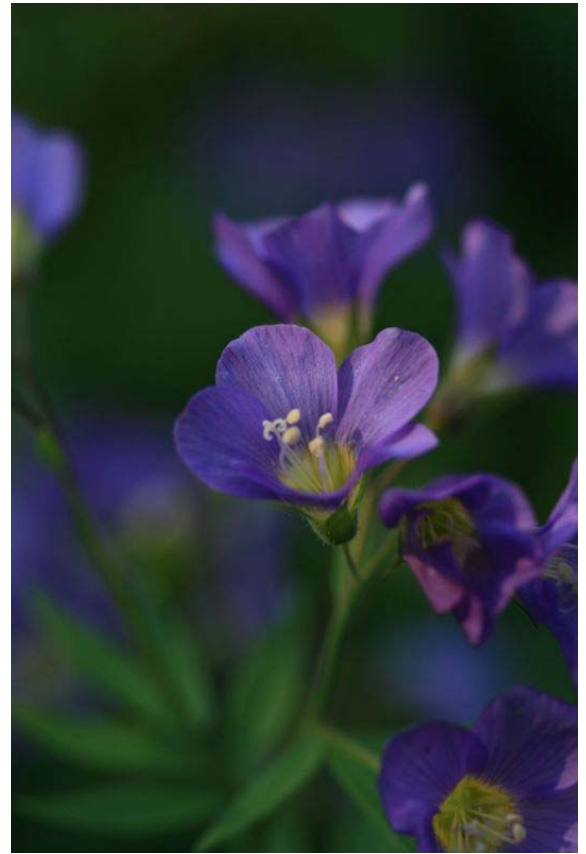
何という名前の花なんでしょう？ 誰か御存知ありませんか？