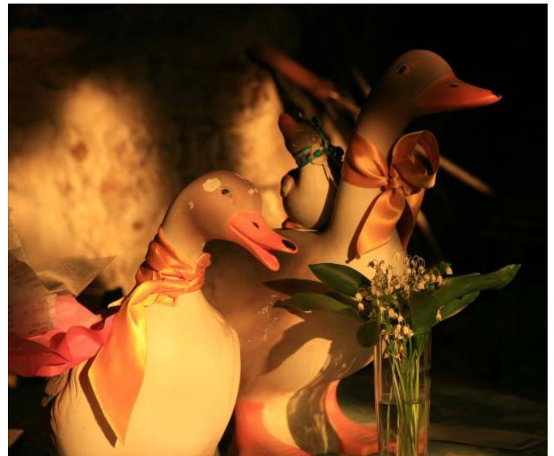
5月1日には森で鈴蘭を摘んできて家に飾ると幸福が訪れるとのことである。このレストランでも飾ってあった。 夕食はブルゴーニュ風フォンデュ。サラダやパンもついて2名分55ユーロとリーズナブルで美味でした。)