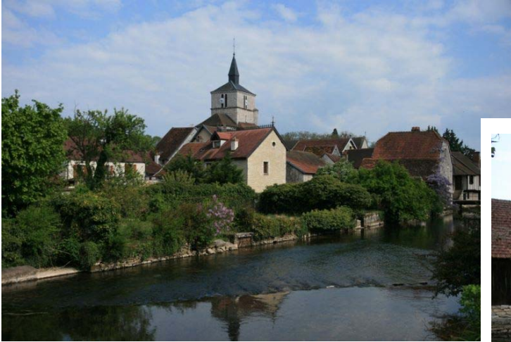
Béze 村の中心にある教会。

フランス、ブルゴーニュのカミさんの実家近くに Béze という小さな村に水源があると聞き、「まさか滝が？」と思い、勇んで出かけてみました。