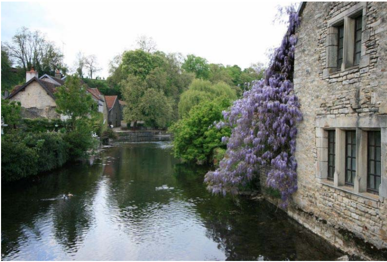
フランスも春真っ盛りで、花が沢山です。 これは藤の一種なんでしょうね、やっぱり。