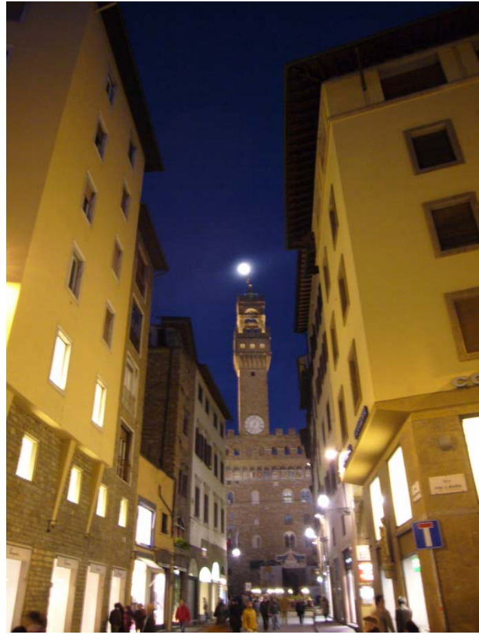
フィレンツェの時計台と満月