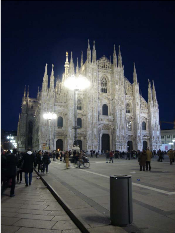
ミラノのドウモ付近。(レンタサイクルもありました。)

出張なので、写真が撮れるのは、夕食に行くときぐらいなので、いつも夜景が中心になってしまいます。仕事なので一眼レフと三脚を持って行くことは出来ないのです、手ぶれが悩みの種です。パナソニックの Lumix を使っているのですが、携帯に便利で、夜景に強いコンデジがあれば、教えてください。