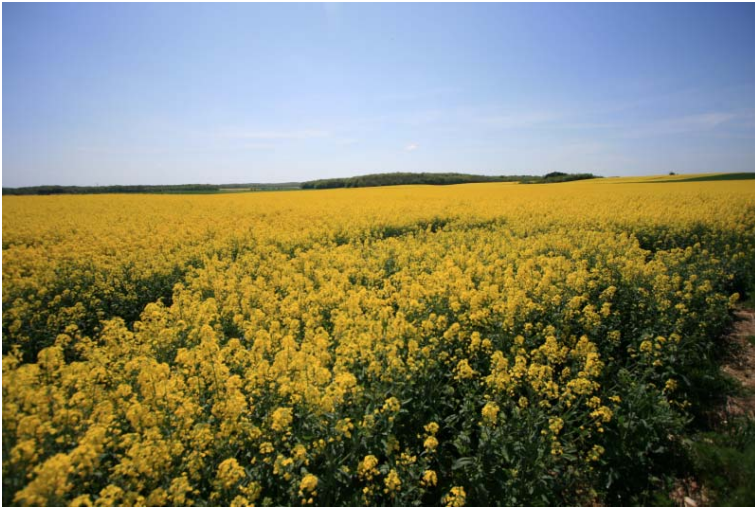
地平線まで続く菜の花畑

こんだけ、菜の花がある割には、日本のように菜の花料理が一般的でないのはなぜだろう？