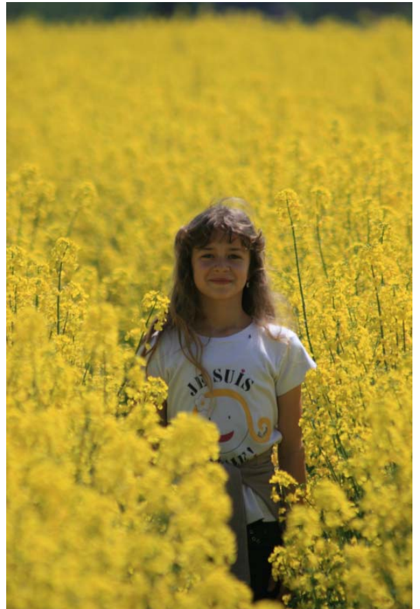
この直後、臭いに負けて退散。